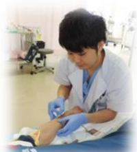
救急外来にて処置