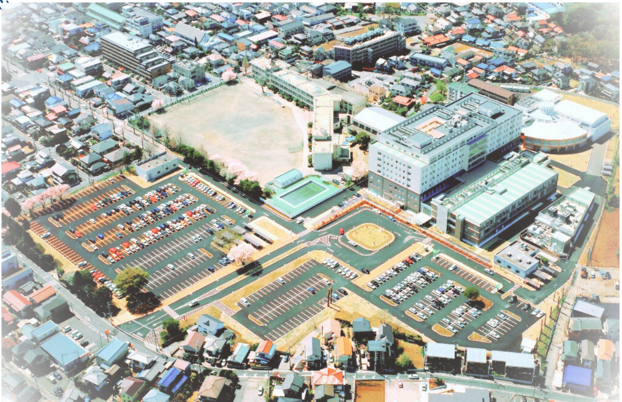
千葉医療センター 航空写真