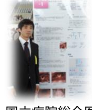
国立病院総合医学 学会での発表