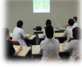
レジデントレクチャー